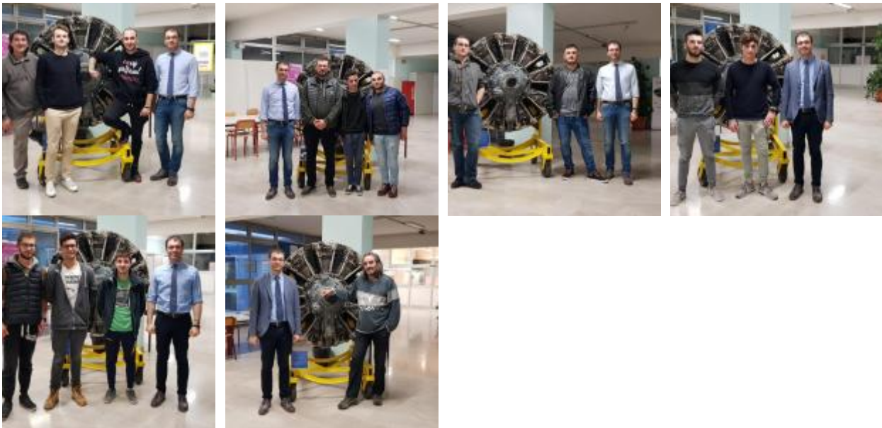
Studenti dell'ISIS Solari di Tolmezzo certificati ACU al Malignani