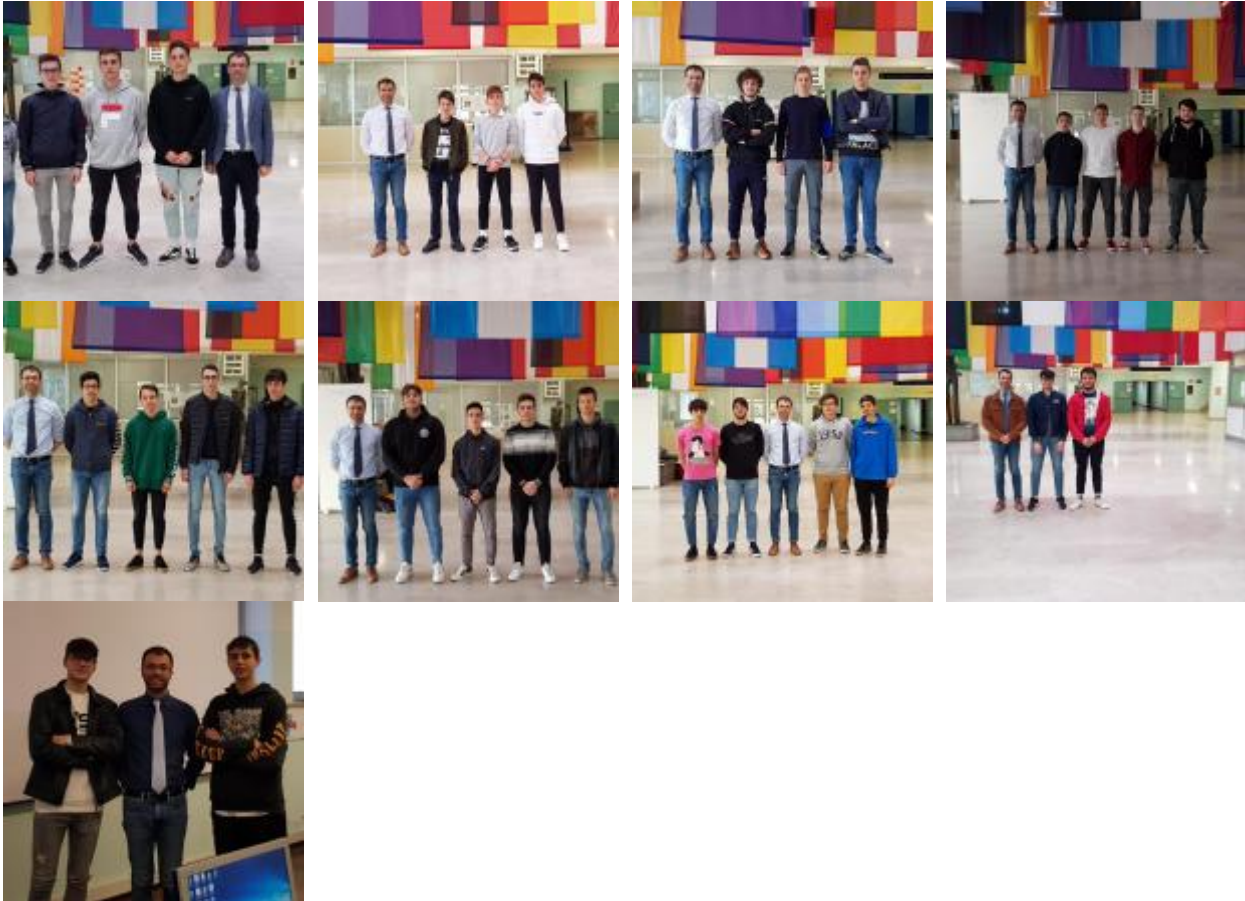
Studenti del Malignani certificati ACU (serale)